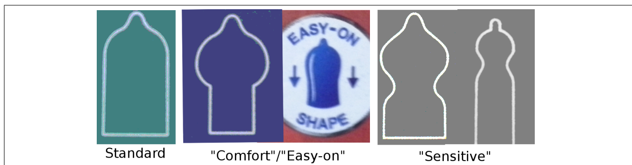
Рис. 3: Некоторые формы презервативов, как они изображены на пачках.

В эту же категорию входит наличие/отсутствие спермоприёмника(пимпочки) на конце. Подавляющее большинство презервативов в наши дни оборудованы таким, однако встречаются и без. По поводу достоинств-недостатков этой фишки ничего определенно сказать не могу, однако можно предположить, что она отнимает часть ощущений, зато чуть увеличивает безопасность.