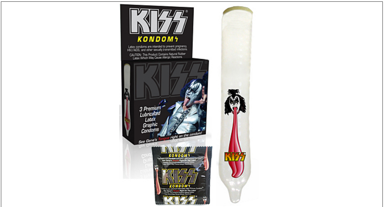
Рис. 2: Кто хотел повертеть кумира на хую?